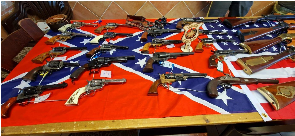
Raritäten, ohne Ende...Perlmuttergriffe, Horn, Gravuren...