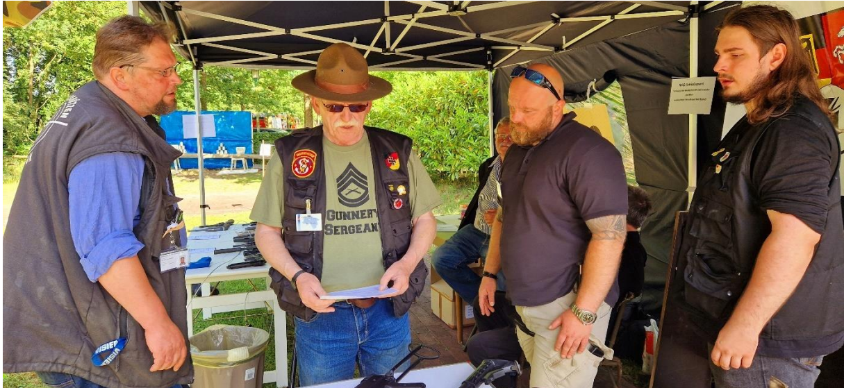
Briefing zur Standaufsicht durch verantwortliches, ausgebildetes, professionelles, Aufsichtspersonal...